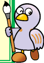
埼玉県マスコット 「コバトン」