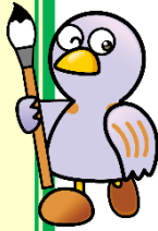
埼玉県マスコット 「コバトン」