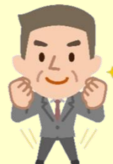
使用者委員 (企業経営者、 経済団体役員など)