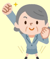
公益委員 (弁護士、学識経験者など)