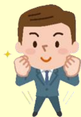
労働者委員 (労働組合の役員など)