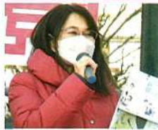
市議会議員 矢野ゆき子