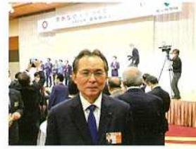
「豊かな埼玉をつくる 県民のつどい」会場で