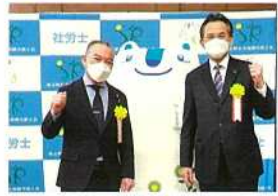
社会保険労務士会の交歓 会で、伊藤岳参院議員と