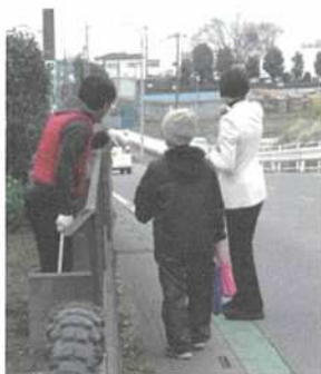
県道57号線を現地調査

上尾市西貝塚を通る県道57号さいたま鴻巣線は、大型車含め交通量が多いにもかかわらず、歩道がとても狭く、危険です。道路を拡幅するには住民合意が必要なため、なかなか困難もありますが、「せめて傷みの修繕を」「下水が通っているあたりの道路が歪んでいる」との声が寄せられたので、現地調査へ。たしかに、傷みが激しい場所が複数ありました。