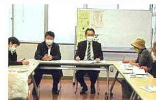
鳩ヶ谷で、議会報告