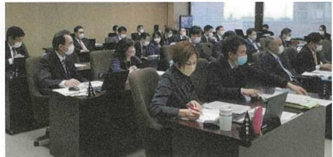
審議している委員会の様子

その他にも、共産党として、 県営団地 の増設や 県産木材 の利用拡充、 デジタル化 により懸念されることなどについても県に質しました。