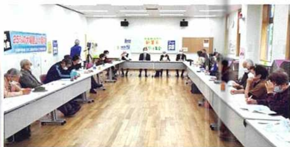
新署名スタート集会風景