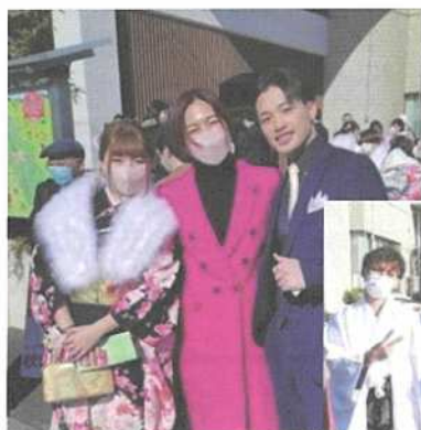
1月9日の「二十歳のつどい」で