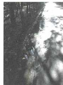
大宮ゴルフ場を通る県道57号線。水はけが悪く、道路が冠水。

また、県道57号は上尾市小泉の大宮ゴルフ場内も通っていて、側溝に落ち葉などがたまり、水はけが悪くなっているとの情報が寄せられました。いずれの要望も、北本県土整備事務所にお伝えし、適切な修繕・側溝の掃除をお願いしました。