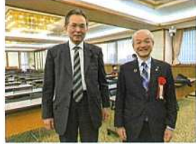
埼労連のつどいで、頼 高英雄藤市長と