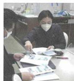
県警本部に詳細説明

年明けに、埼玉県警本部に直接要望を届けました。今後、現地を見てもらい、どうしたら設置できるか、相談したいと思います。