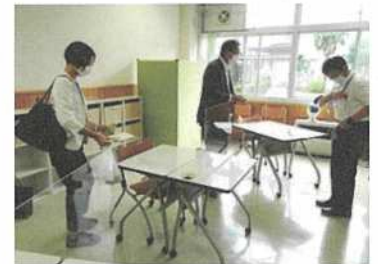
「いっぽ」の教室を視察

義務教育段階の不登校生徒について、県が具体的な支援に踏み出したことは大いに評価できます。今後は、ここでの取り組みを検証しながら、県内にも広げていきたい、とのことでした。