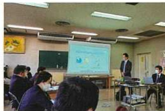
滋賀県企業庁で説明を聞く

11月21日、22日、県議会環境農林委員会で、滋賀県を視察。21日には、滋賀県企業庁・馬淵浄水場の長福寺マイクロ水力発電所を視察しました。22日には、彦根市のフクハラファームを視察。ファームは本州最大規模の約2000畝の農地を預かる農業法人で、スマート農業の推進、アイガモ農法、有機栽培など、様々な手法を駆使して頑張っている農家です。