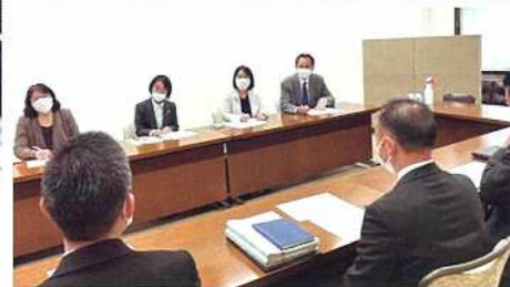
埼玉県警に要望する