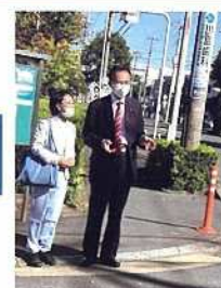
横断歩道を調査する