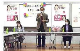
「市民のつどい」で訴える