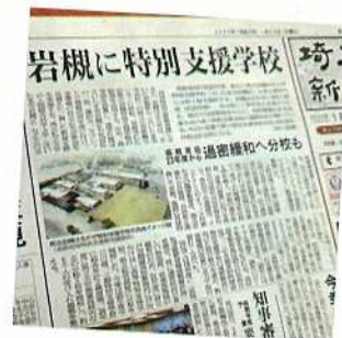
埼玉新聞1月24日付け

新年度から岩槻はるかぜ特別支援学校が開校します。党県議団が県政に届け実現できなかった。学校新設で、過密状況が一歩緩和されていきます。また、1月には、待ちに待った県医療的ケア児等支援センターも開設されました。党県議団も医療的ケア児への支援強化をくりかえし県に要望し、実現しました。