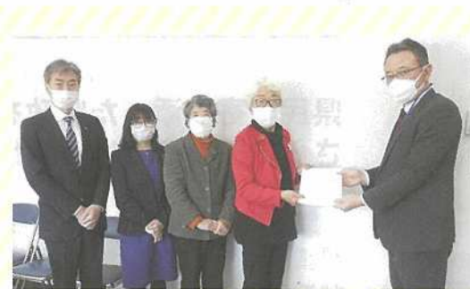
三芳町議団と、県土整備事務所へ歩道整備などの要望書を提出しました

毎年、川越県土整備事務所に対し、国道、県道の整備、新河岸川の治水対策などの予算要望を行っています。この度、県道並木川崎線の歩道整備方針が示され、葦原中学校東交差点から川崎にある消防署までの区間の現地調査を再度行いました。