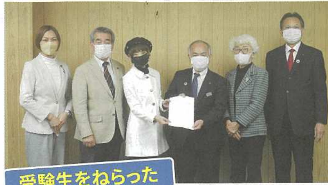
受験生をねらった

2020年の12月議会では民青同盟の活動を紹介しながら、学生への支援を県に求めました。引き続き学生支援を県段階でも実現できるようがんばります。