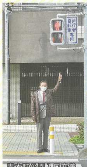
青木町公園入口交差点の信号機に時間表示がつけました