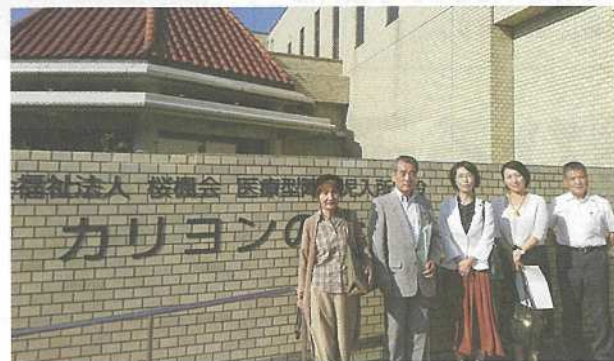
医療型障害児入所施設カリヨンの杜視察

党県議団は2020年2月議会の一般質問で知事に対し、障害児者の入所施設整備を計画的に行っていくことを求めました。知事は「今後も、重度の障害者のため、必要な入所施設の整備を進めてまいります」と答弁。2022年度当初予算に重度障害者のグループホーム整備の予算が盛り込まれました。