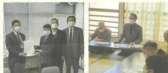
上谷沼調節池について県土整備事務所に要請