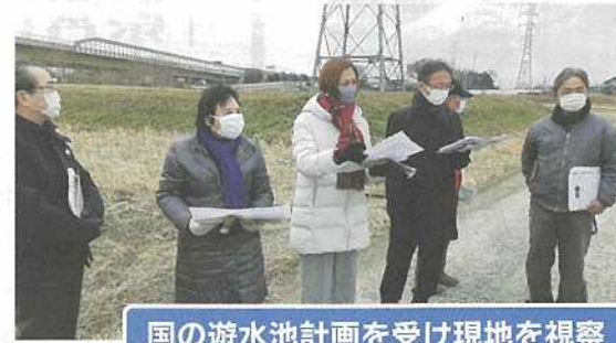
国の遊水池計画を受け現地を視察