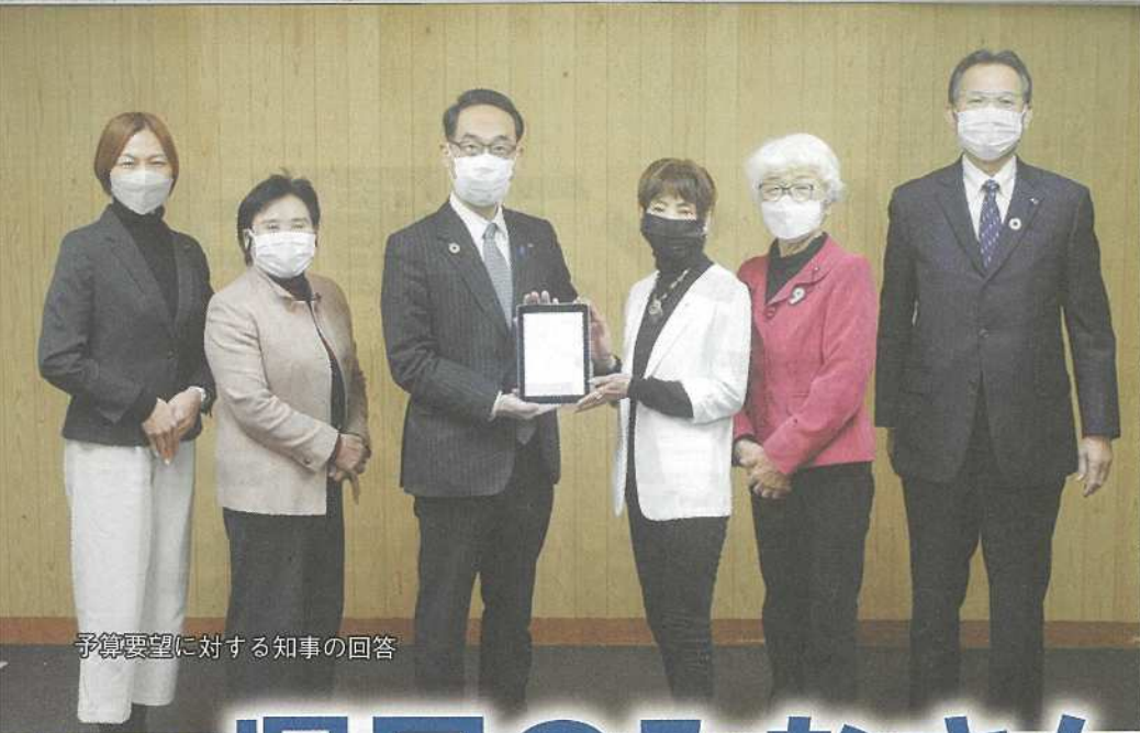
予算要望に対する知事の回答