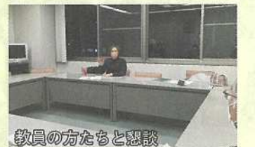
教員の方たちと懇談

党県議団は2020年と2021年の12月議会で教員の未配置・未補充の問題を取り上げ、早急な対策を求めてきました。しかし、2022年2月1日時点を見ると小学校・中学校で144人不足だったものが190人とさらに増えていました。教員の未配置・未補充の根底には教員の必要数ギリギリの定員となっている問題があり、党県議は県独自に定数を引き上げること、せめてスクールサポートスタッフを県独自に増員することを求めました。