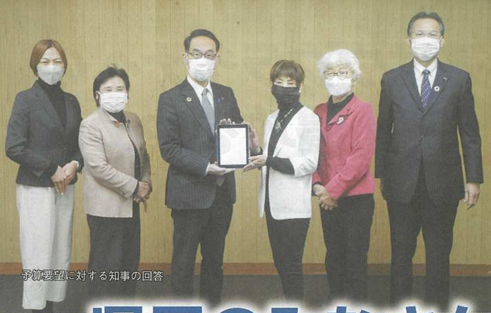
予算要望に対する知事の回答