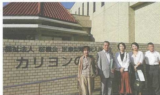
医療型障害児入所施設カリヨンの杜視察

党県議団は2021年9月議会の一般質問で医療的ケア児のおかあさんの手紙を紹介し、医療的ケア児の実数や症状の調査・把握などの支援を求めました。そして2022年度当初予算に、医療的ケア児支援センターの設置が盛り込まれました。