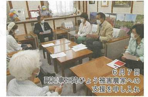
6月7日 副知事に降ひょう被害農家への支援を申し入れ

補正予算第3号には、6月2日と3日県北・東部の降ひょうによって損失を受けた農業者に対して、被害作物の生育回復等の費用を補助する市町村を支援するため8億4000万円余りが計上されました。党県議団はこれらを評価するとともに一般質問や委員会質疑で、作物の全滅で収入を失った農業者の生活への支援を求めました。また、農業共済制度が被害をカバーするものになっていないことから、その改善を求めました。