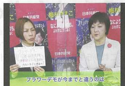
フラワーデモが今までと違うのは