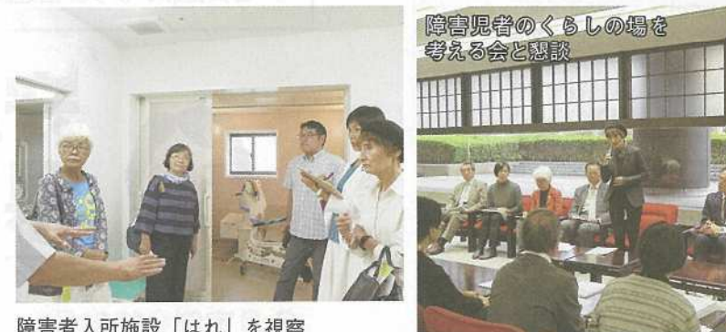
障害者入所施設「はれ」を視察