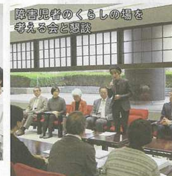
障害児者のくらしの場を 考える会と懇談