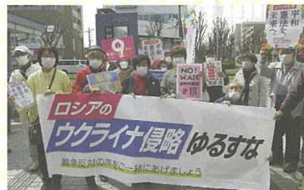
ふじみ野駅西口でふじみ野市議団と市民団体の方たちと一緒に宣伝