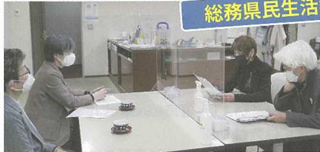
ジェンダー平等埼玉の方たちと懇談