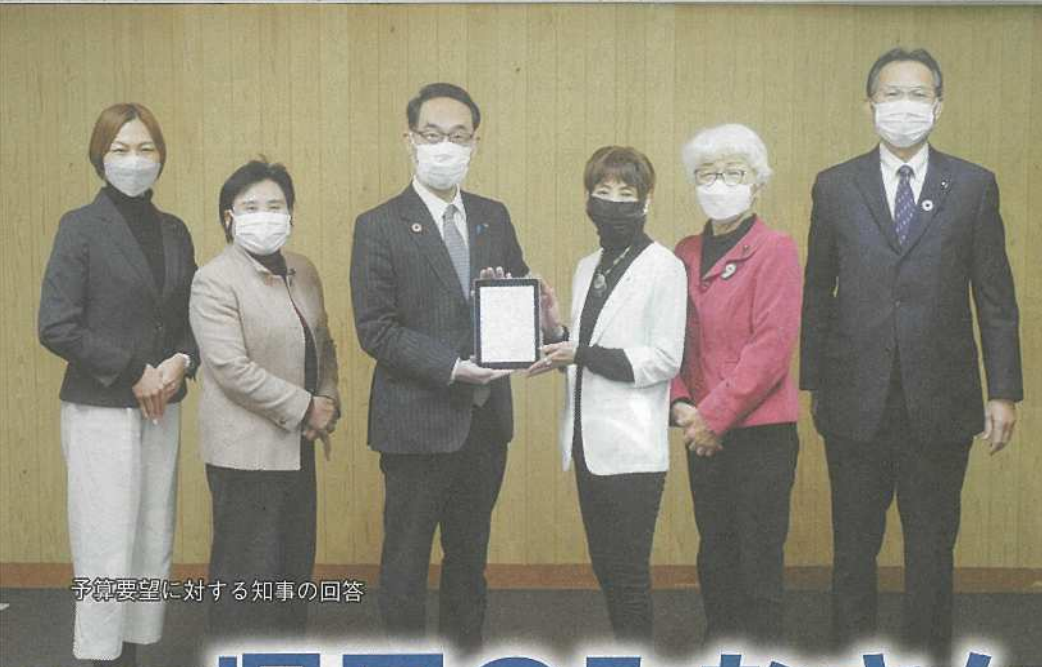
予算要望に対する知事の回答