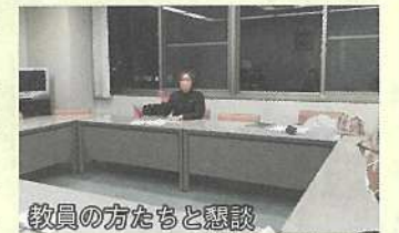
教員の方たちと懇談

党県議団は2020年と2021年の12月議会で教員の未配置・未補充の問題を取り上げ、早急な対策を求めてきました。しかし、2022年2月1日時点を見ると小学校・中学校で144人不足だったものが190人とさらに増えていました。教員の未配置・未補充の根底には教員の必要数ギリギリの定員となっている問題があり、党県議は県独自に定数を引き上げること、せめてスクールサポートスタッフを県独自に増員することを求めました。