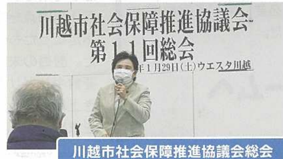
川越市社会保障推進協議会総会