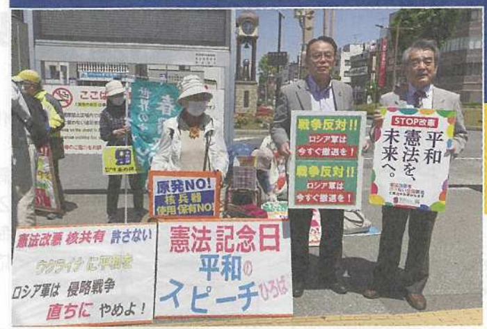
街頭で積極的にウクライナ問題を訴えています

埼玉県議会では、2月28日ロシアのウクライナ侵攻に対し強く抗議する決議が全会一致で採択されました。党県議団は、予算特別委員会の場で、難民がまともに医療行為を受けられないことを指摘し、外国人未払い医療費助成制度の拡充を求めました。また党県議は、総括質疑で、ウクライナ避難民のみなさんが十分な医療を保障されるよう強く知事に求めました。