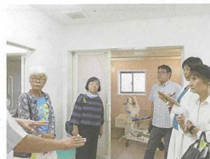
障害者入所施設「はれ」を視察

党県議団は2020年2月議会の一般質問で知事に対し、障害児者の入所施設整備を計画的に行っていくことを求めました。知事は「今後も、重度の障害者のため、必要な入所施設の整備を進めてまいります」と答弁。2022年度当初予算に重度障害者のグループホーム整備の予算が盛り込まれました。