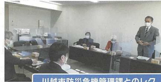
川越市防災危機管理課とのレク