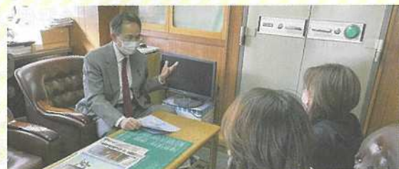
飲食店の方から協力金の相談