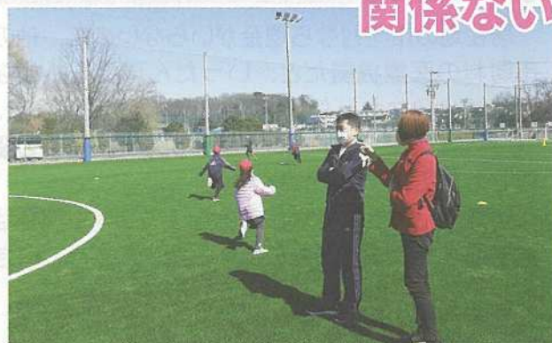
埼玉朝鮮初中級学校の校長先生と懇談

予算特別委員会の部局別審査では、朝鮮学校への県私学助成不支給問題を取り上げました。県は、「拉致問題が解決されるまで予算の執行を留保すべき」との県議会の附帯決議（平成24年）を補助金不支給の理由としています。拉致問題の解決は日本政府が外交的に解決すべき問題であり、朝鮮学校の子どもたちはまったく関係がないことです。補助金支給の再開を強く求めました。