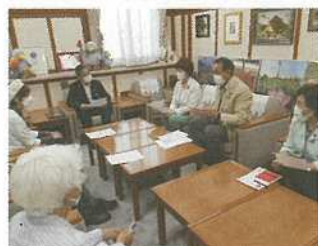
6月7日副知事に降ひょう被害農家への支援を申し入れ

定例会では、3件の令和4年度埼玉県一般会計補正予算をはじめ、26件の知事提出議案と、埼玉県性の多様性を尊重した社会づくり条例など12件の議員提出議案が可決・同意・承認されました。党県議団は、自民党提出の部落差別解消条例はじめ3件の議員提出議案に反対しました。