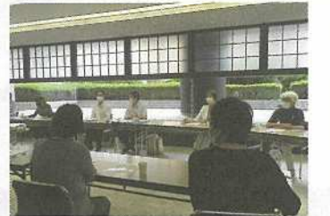
障害者の暮らしの場を考える会の県との懇談に同席

保護者の高齢化とともに障害者の入所施設やグループホーム整備の要望が切実になっています。県議団が障害者団体とともにくり返し要望するなか、県がグループホーム建設の 単独補助 を創設しました。