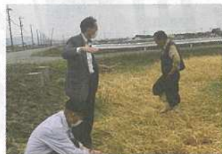
県北部降ひょうの農作物被害を視察