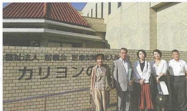
医療型障害児入所施設カリヨンの杜視察

党県議団は2021年9月議会の一般質問で医療的ケア児のおかあさんの手紙を紹介し、医療的ケア児の実数や症状の調査・把握などの支援を求めました。そして2022年度当初予算に、医療的ケア児支援センターの設置が盛り込まれました。