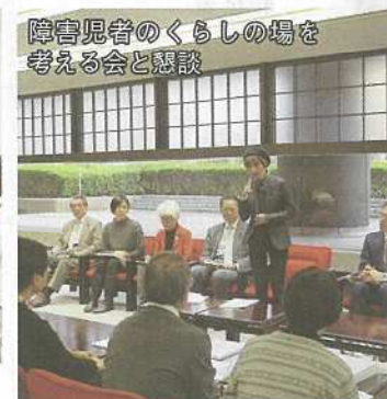
障害児者の暮らしの場を 考える会と懇談