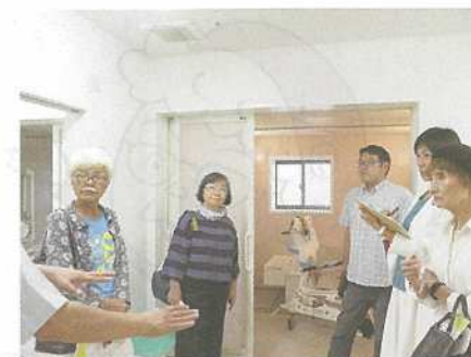
障害者入所施設「はれ」を視察

党県議団は2020年2月議会の一般質問で知事に対し、障害児者の入所施設整備を計画的に行っていくことを求めました。知事は「今後も、重度の障害者のため、必要な入所施設の整備を進めてまいります」と答弁。2022年度当初予算に重度障害者のグループホーム整備の予算が盛り込まれました。