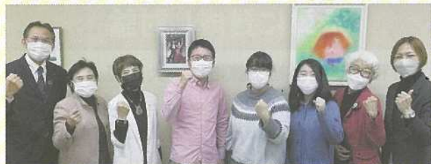
学生の生活支援フードパントリーの取り組みについて民主青年同盟のみなさんと懇談