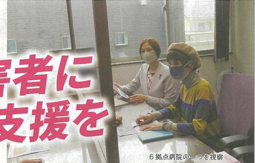
6拠点病院の1つを視察