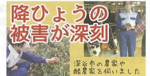
降ひょうの被害が深刻 深谷市の農家や酪農家を伺いました 県北部の被災地農家を視察しYou Tube「秋山もえチャンネル」で発信しました

私は気候危機対策について、知事に「ゼロカーボン宣言」を求めてきました。まだ宣言していない県はあと5県です。宣言を迫る私に対し、知事は「裏付けがなければ意味を欠く」として、県の計画策定後の今年度末以降に宣言することができると答弁しました。