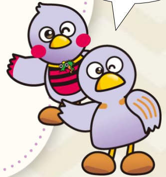
埼玉県マスコット「コバトン」「さいたまっち」