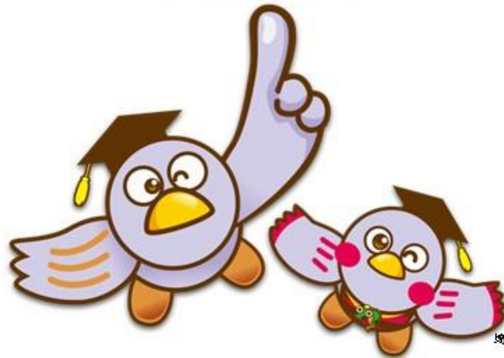
埼玉県マスコット「コバトン」「さいたまっちゃん」