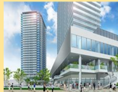
にぎわいをもたらす新たな集客拠点である駅西口地区の再開発の推進