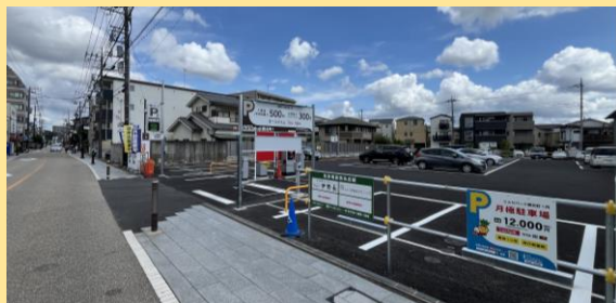
中山道地区における、にぎわいを創出する新たな交流拠点の整備（市役所仮設庁舎跡地を活用）