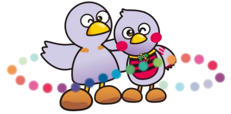
埼玉県マスコット 「コバトン&さいたまっち」