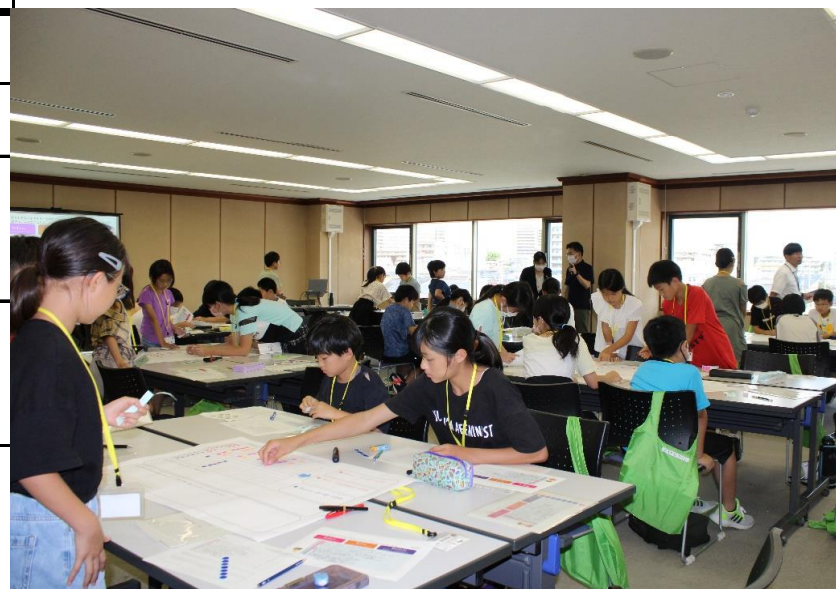
環境にやさしい取り組みって何だろう？みんなで話し合お