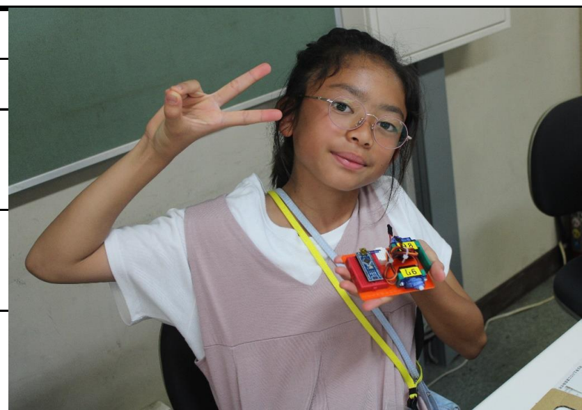
プログラミングカーをつくったよ