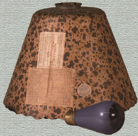
灯火管制用の電灯と電灯カバー