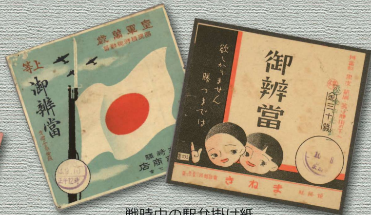
戦時中の駅弁掛け紙