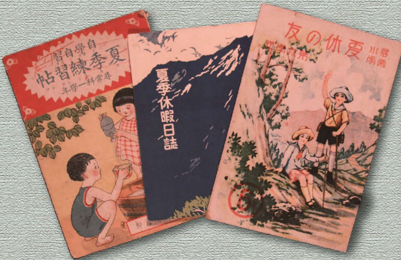
夏季練習帳と夏季休暇日誌、夏休の友