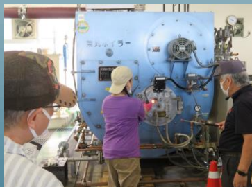
ボイラー実技講習