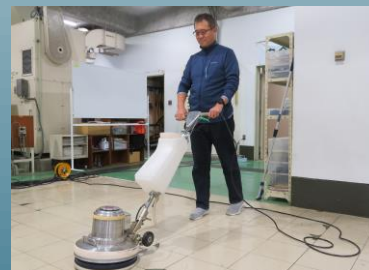
ビルクリーニング実習（床・窓ガラス清掃）