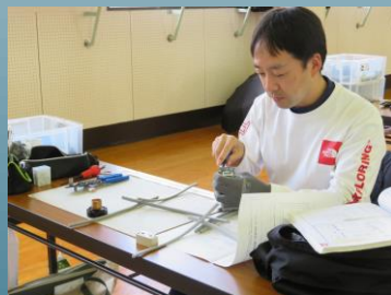
第二種電気工事士技能試験対策