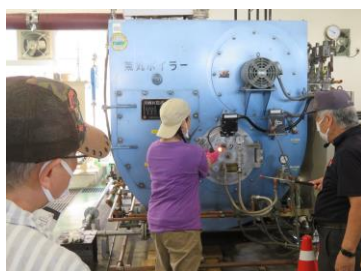
ボイラー実技講習