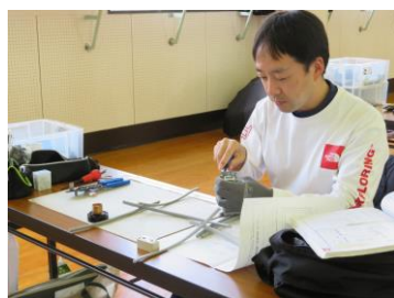
第二種電気工事士技能試験対策