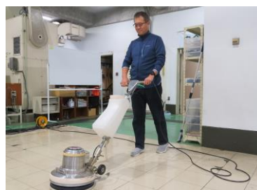
ビルクリーニング実習（床清掃）