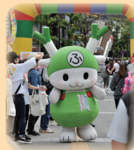
県の有名ゆるキャラも登場予定！