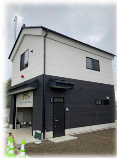
※写真はイメージのため、外壁のデザイン等大きく変更する場合があります