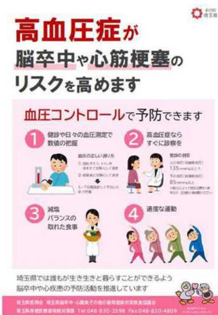
高血圧予防啓発ポスター(A2)