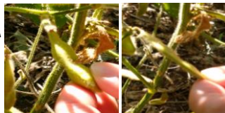
正常さや 不稔さや

大豆: 高温・干ばつの影響で十分に成熟しない 豆が発生 被害面積 307ha(速報値)