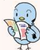
県議会マスコット「ポッポ」

※音声コードUni-Voiceは専用アプリだけでなく、活字文書読み上げ装置でも読み取り可能です。