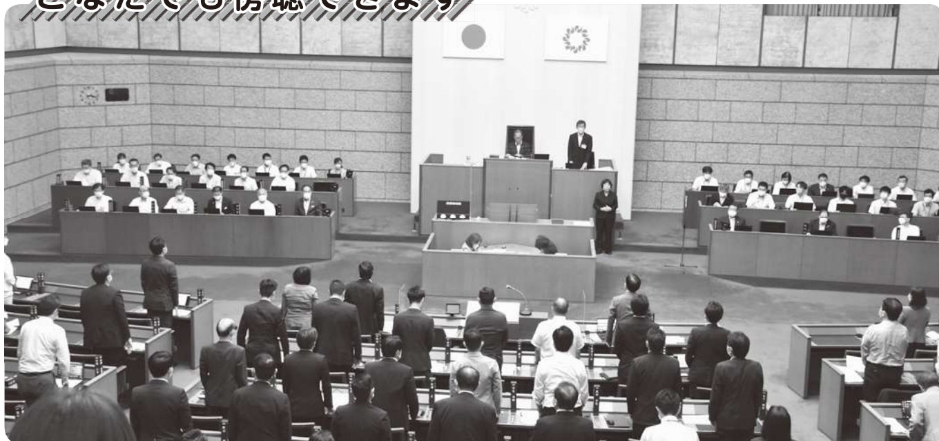
本会議場（令和4年6月定例会）

県議会の本会議は、県議会議事堂4階の傍聴者受付で手続きをしていただければ傍聴ができます。本会議の傍聴席は216席です。また、委員会も受付で手続きをしていただければ傍聴ができます。ご用意している傍聴席は、各委員会とも20席です。本会議、委員会ともに車いすのままでも傍聴ができます。