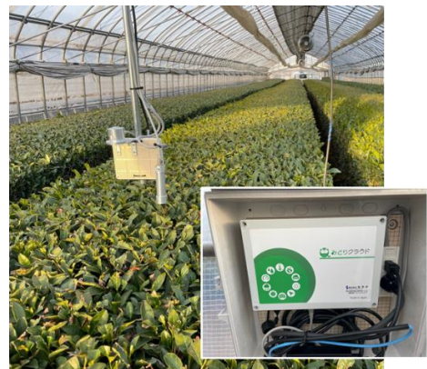
入間市農業研修センターに設置したセンサー