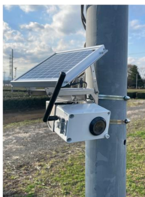
茶業研究所圃場に設置したカメラ