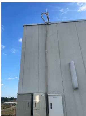
茶業研究所屋上に設置した11ahアンテナ