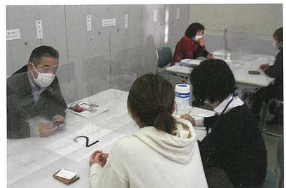
ネットワークミーティング (マッチング会)