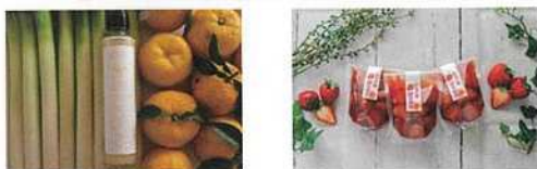
県HP (SAITAMAわっしょい!) で商品紹介