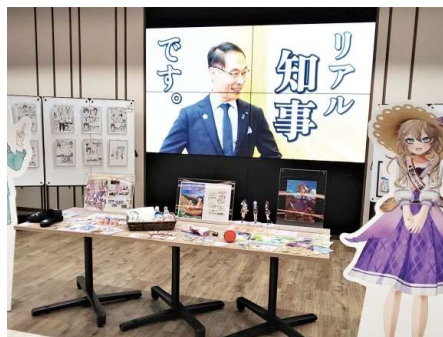
埼玉のポップ カルチャーを発信 「アニ玉祭」 コラボイベント (22年10月)