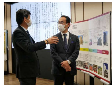
創業70周年記念 「大宮歴史写真展」 (22年12月 ～23年2月)