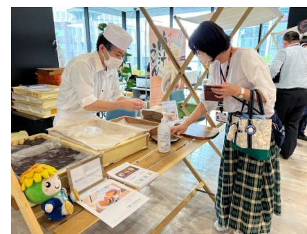
県産小麦の 魅力発信 「小麦マルシェ」 (22年9月)