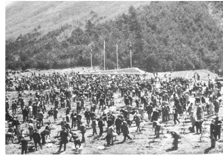
【昭和46年(1971年)4月16日 大田市三瓶山北の原において開催された第22回全国植樹祭】