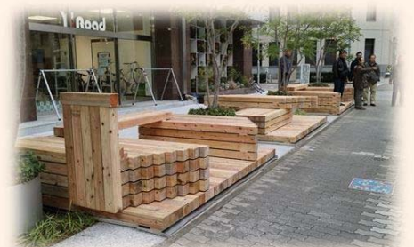
ウッドデッキ(名古屋市)