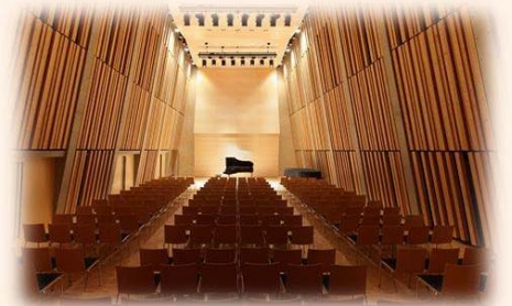
愛知県立芸術大学(長久手市)