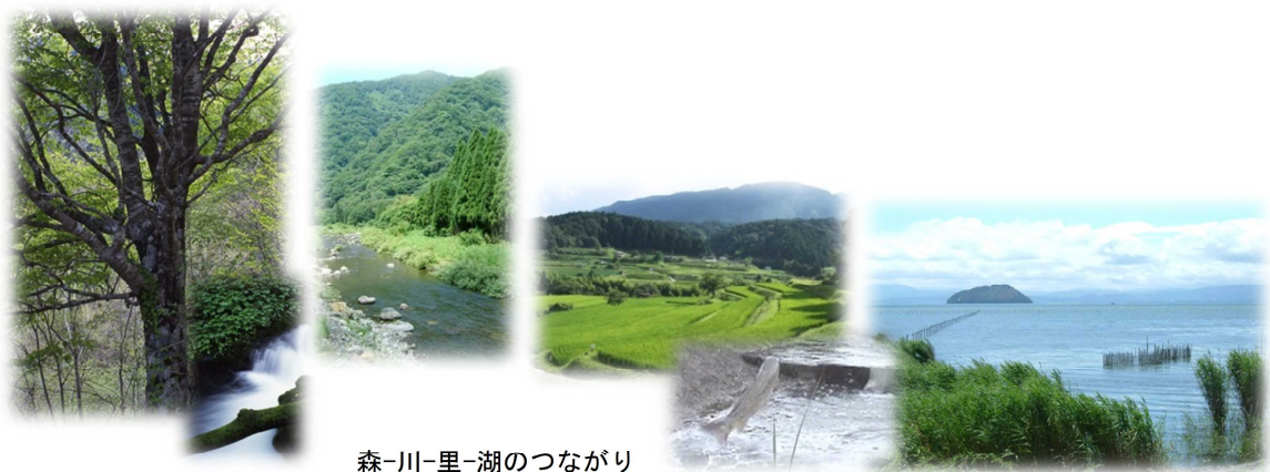
森-川-里-湖のつながり

森林と私たちの暮らしのかかわりを振り返ると、古代より、奈良や京都そして滋賀の壮麗な宮殿・社寺の建設には、滋賀の木材が多く利用されてきました。また、中世・近世・近代にかけて、人々は貴重な森林資源を巡り、争い、話し合い、力を合わせるというドラマを展開してきました。一方、県内には山村地域を中心に多種多様な森林文化が根付いています。木を植え、育て、伐って利用し、また植えるという先人たちの取組は、まさに持続可能な森林づくりの礎であり、現在に暮らす私たちもしっかりと次の世代に受け継いでいく必要があります。また、「せっけん運動 ※1 」をはじめ、湖岸の清掃やヨシ刈りなど琵琶湖の環境保全に熱心に取り組む姿勢や、琵琶湖の下流域で水を利用する人々を気遣う思いやりの精神は、滋賀の県民性として私たちの暮らしの中に定着しています。