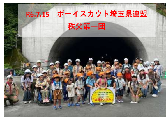
R6.7.15 ボーイスカウト埼玉県連盟 秩父第一団