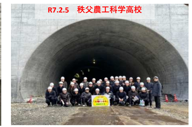
R7.2.5 秩父農工科学高校