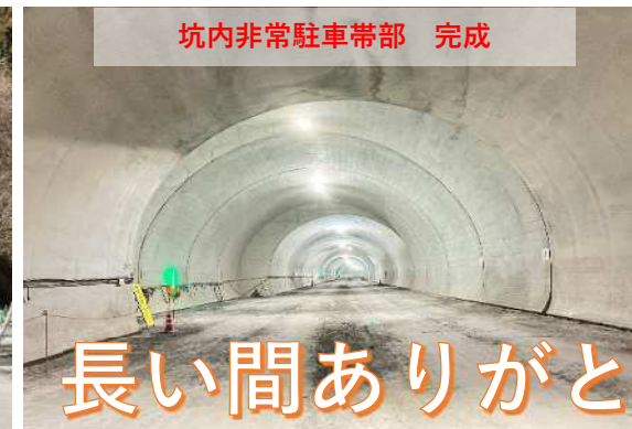
坑内非常駐車帯部 完成