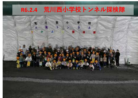
R6.2.4 荒川西小学校トンネル探検隊