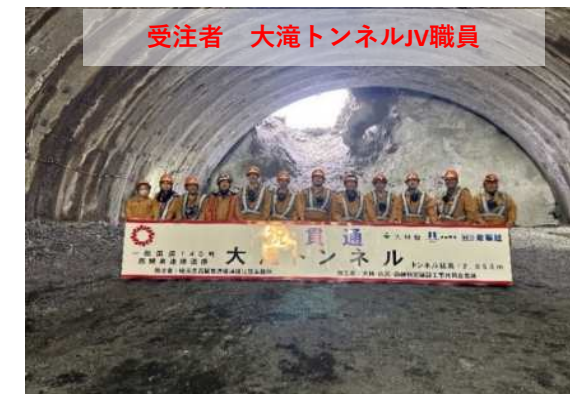
受注者 大滝トンネルJV職員