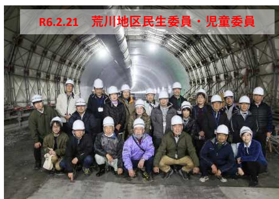
R6.2.21 荒川地区民生委員・児童委員