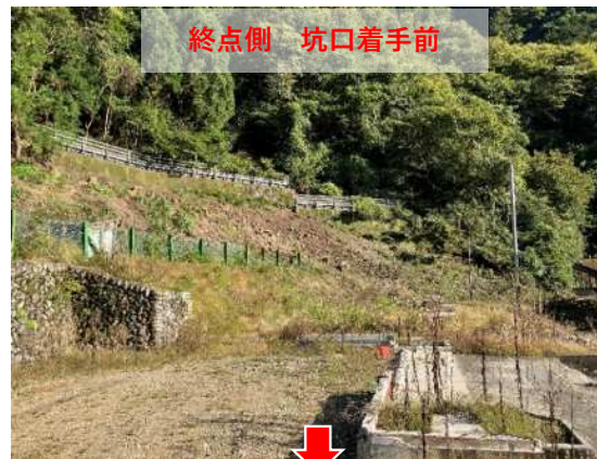
終点側 坑口着手前