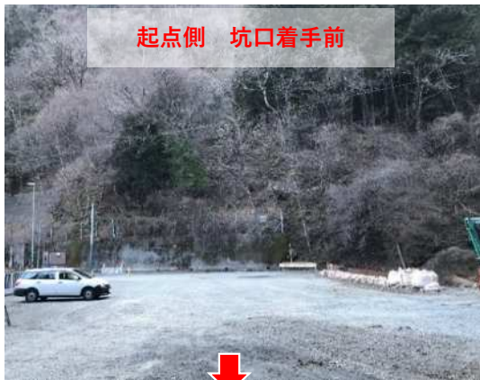
起点側 坑口着手前