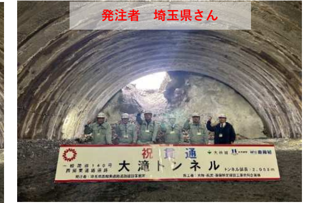
発注者 埼玉県さん