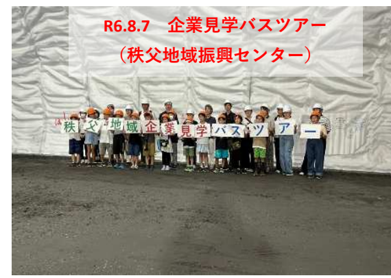
R6.8.7 企業見学バスツアー (秩父地域振興センター)