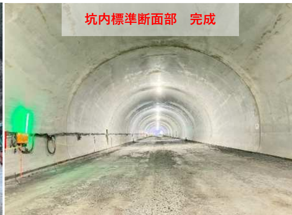
坑内標準断面部 完成