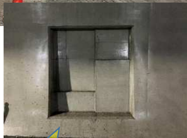
上り線・下り線に箱抜きを設置し将来消火栓等が付きます。