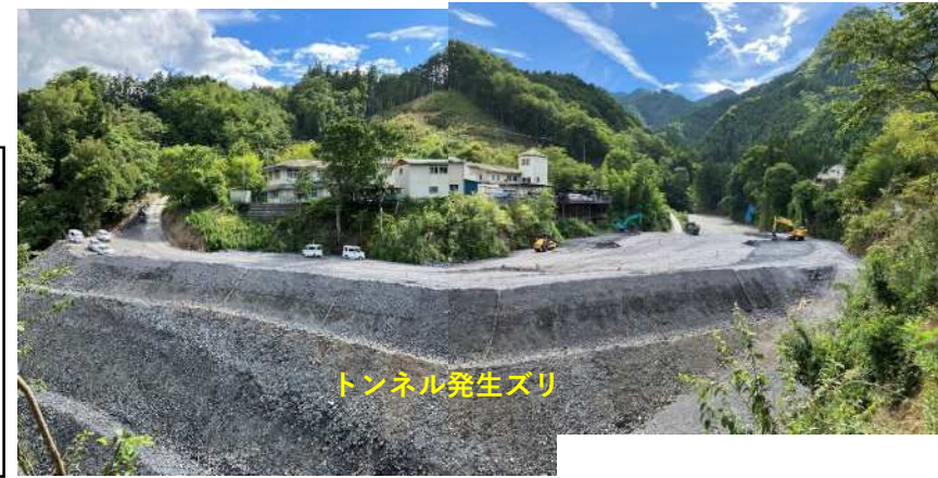
残土運搬 トンネル掘削で発生したズリは、古池地区の『皆野両神荒川線バイパス』へ残土運搬しています。