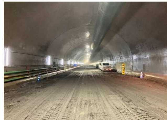
覆工 標準断面部が437m進みました。右写真は非常駐車帯（故障車等が退避する場所）取合い部を施工している所です。