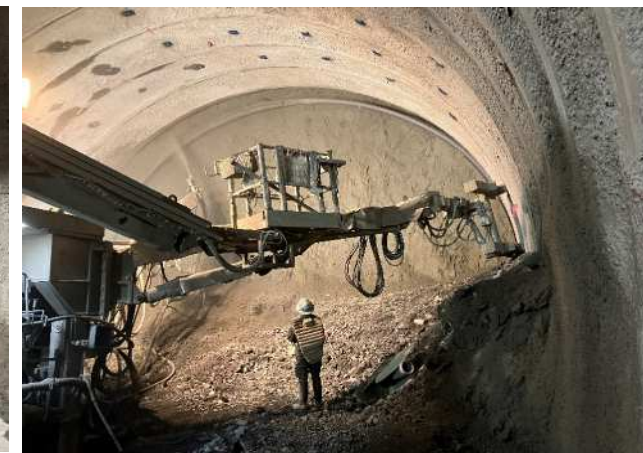
トンネル掘削 トンネル入口より1560m付近を掘削しています。右側写真は（吹付けコンクリート作業中）です。