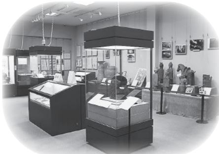
東松山市埋蔵文化財センター (展示室)

東松山市埋蔵文化財センターでは、反町遺跡をはじめ、市内の遺跡から出土した資料を展示しています。