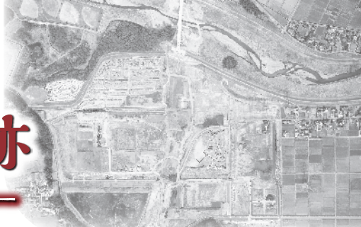
反町遺跡 (空中写真)