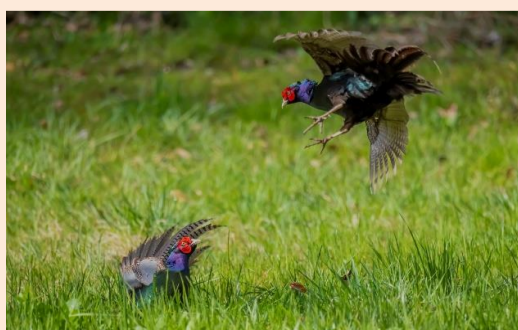
Green Pheasant 小堀 文彦