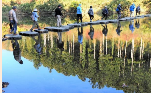
彩りを渡る 船塚 和雄