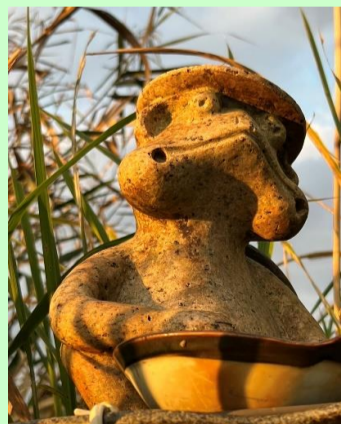
今日も 良い日だったなあ 川崎 信幸