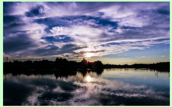
黒浜沼の夕景 花田 寛子