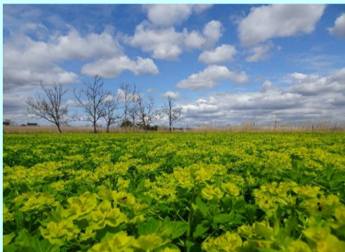
花の色、雲の影 藤原 正宜