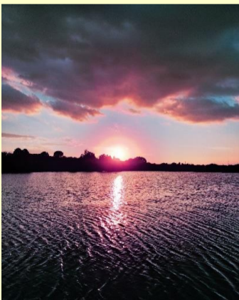
真夏の夕焼け 八須 陽大