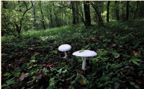
森のUF0 橋本 英男