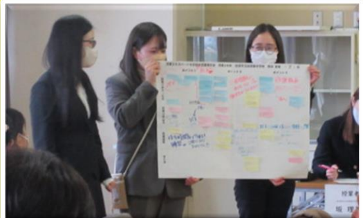
各班の協議内容の発表