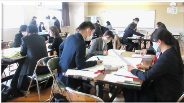
『私の授業の観てほしいポイント』に沿った研究協議