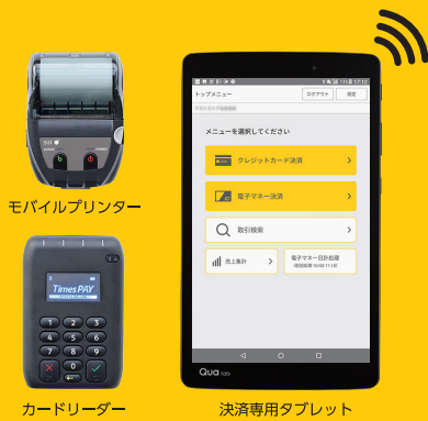
モバイルプリンター