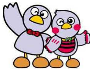
埼玉県マスコット 「コバトン」「さいたまっち」