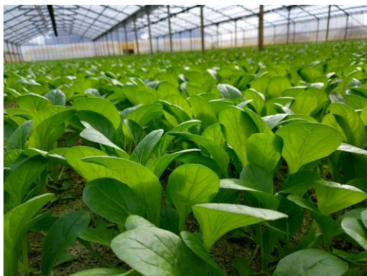
(写真：きれいに管理されたほ場)