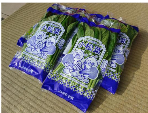
(写真：出荷前のこまつな)