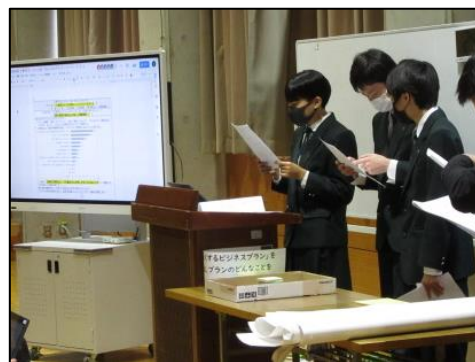
班で考えたビジネスプランを発表する場面