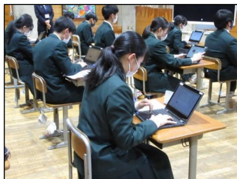
タブレット端末で相互評価を入力する場面