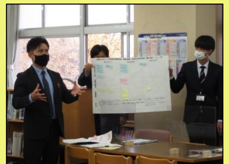
各班の協議内容の発表