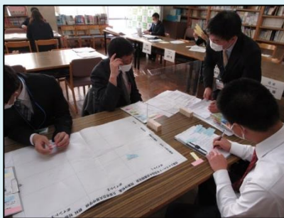
「私の授業の観てほしいポイント」に沿った研究協議