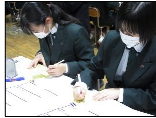
自分が特に取り組みたいものを選択し、「Myビジネスプラン」を完成させる見通しをもつ場面