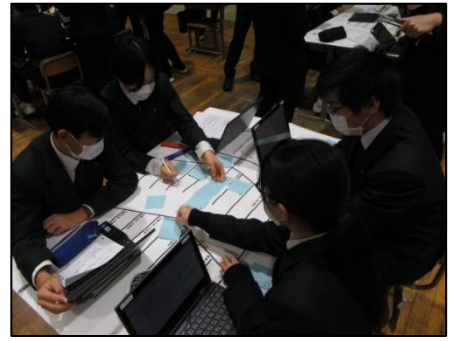
「経営会議」という設定でビジネスプランの改善策を検討する場面