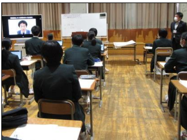
商工会の経営指導員から評価のフィードバックを受ける場面