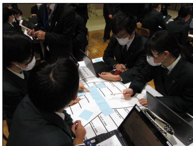
班で考えたビジネスプランについて改善案を検討する場面