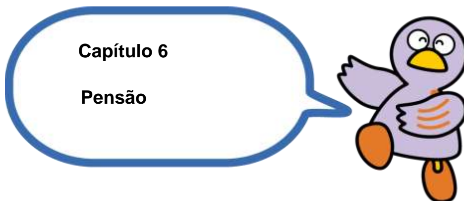
Mascote de Saitama KOBATON