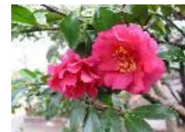
カンツバキ”獅子頭”