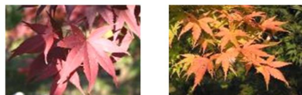
猩々(しょうじょう) 珊瑚閣(さんごかく)