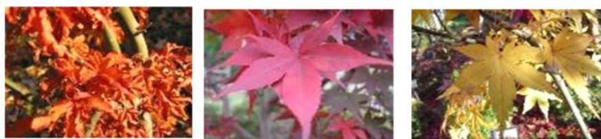
獅子頭(ししがしら) 大盃(おおさかずき) 浮雲(うきぐも)