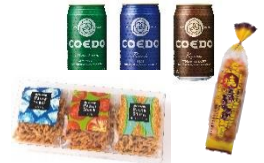
抽選で当たる県産品（一例）