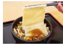
川幅うどん（鴻巣市）