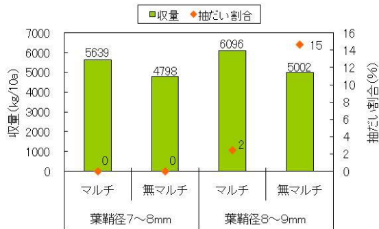
図2 苗の太さ、マルチの有無と抽だい割合、収量