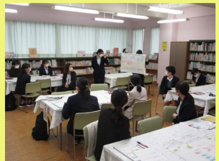
各班の協議内容の発表