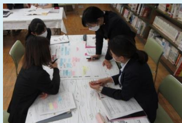
『私の授業の観てほしいポイント』に沿った研究協議