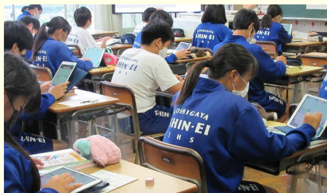
ICTを効果的に活用し、相手意識・目的意識をもちながら、意欲的に自分の考えを表現する生徒の姿