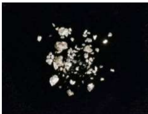
自然白金（プラチナ）[北海道深川市] (国立科学博物館蔵)