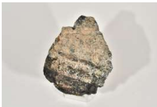
蛇紋岩(秩父郡皆野町)