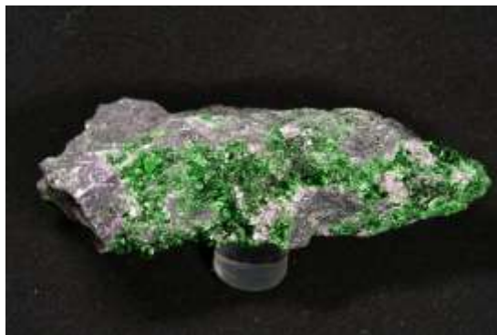
秩父ひすい（ネフライトの一種）〔皆野町三沢〕 灰クロム石榴石〔ロシア〕（個人蔵）