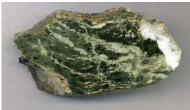
蛇紋岩中の炭酸塩脈〔長瀬町樋口〕

地球のマントルを起源とする蛇紋岩は、地球内部の挙動を知る手がかりとして、またプレート境界型地震発生のカギとなる物質として注目され、研究が進められています。最新の研究成果を標本とともに紹介します。