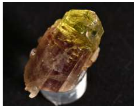
ベスブ石 [カナダ] (個人蔵)