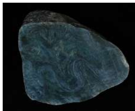
硬玉(ひすい)の原石