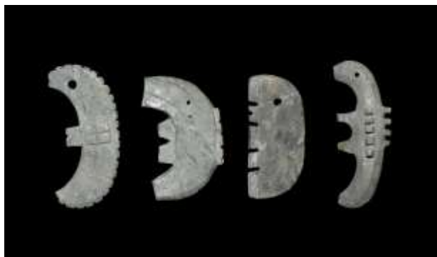
滑石製子持勾玉[行田市北大竹遺跡] (埼玉県教育委員会蔵)