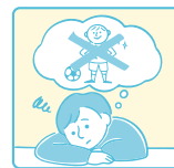
未来に夢や希望を 抱くこと