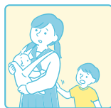
幼いきょうだいの 世話をしている