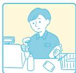
家計を支えるために 労働をして助けている