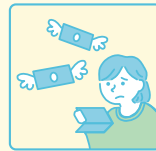
収入を自分のために 使うこと