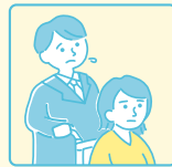
自由に就職先を 選ぶこと