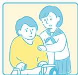
身体的なケアをしている (看病、見守り、トイレの介助など)