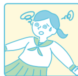
心と体を休めること