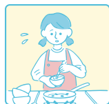
買い物・料理・洗濯 などの家事をしている