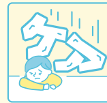
自分中心の 人生を歩むこと