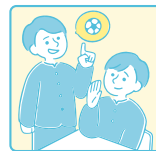
友達と放課後に 遊ぶこと