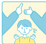
社会的なケアをしている (大人の件職や制度上の手続きなど)