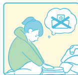
勉強時間の確保や 受験・進学をすること