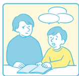
通訳・手話など コミュニケーションの 補助をしている