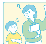
大人に理解され 気にかけてもらうこと