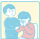
精神的なケアをしている (話し相手になる、愚痴を聞くなど)