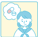
医療的なケアをしている (服薬管理や通院管理など)