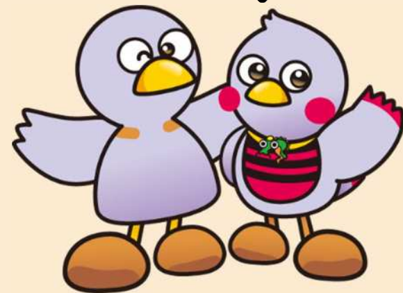
埼玉県マスコット 「コバトン」 「さいたまっち」