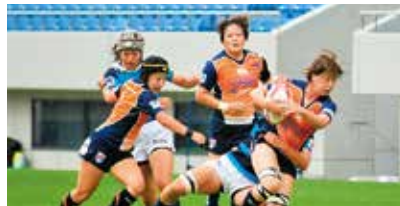
※選手の代わりにチームスタッフが参加する可能性があります。