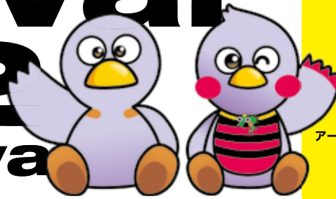
コバトン & さいたまっち