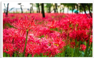
日高市の曼珠沙華