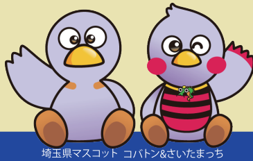
埼玉県マスコット コバトン&さいたまっち