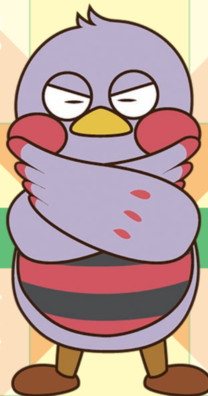
埼玉県のマスコット 「さいたまっち」