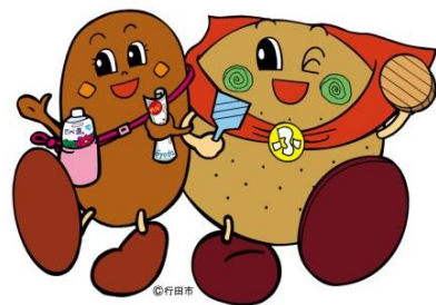
行田市公式キャラクター こぜにちゃん(左)、フラベエ(右)