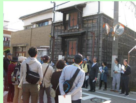
※新型コロナウイルス流行前の実施状況