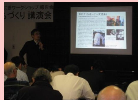
※新型コロナウイルス流行前の実施状況