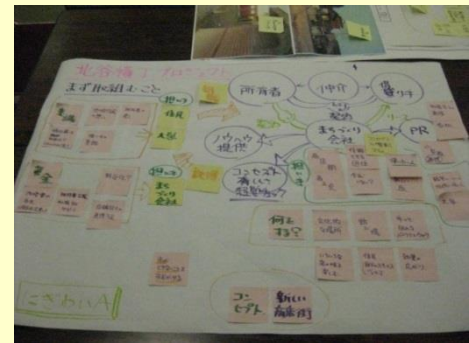
※新型コロナウイルス流行前の実施状況