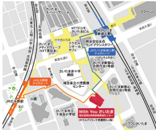
JRさいたま新都心駅より 徒歩3分 JR北与野駅より 徒歩6分

申込時にお子様の名前(ふりがな)、年齢(月齢)、アレルギーの有無をお知らせください。