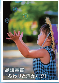
副議長賞「ふわりと浮かんで」