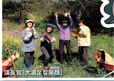
議長賞「大満足な笑顔」