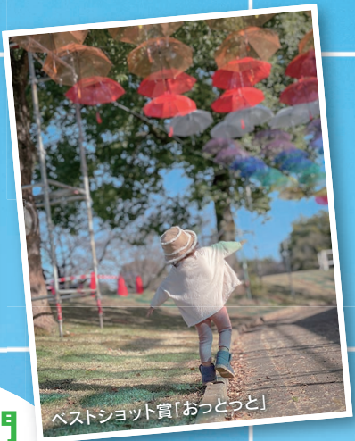
ベストショット賞「おつとつと」