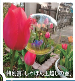
特別賞「しゃぼん玉越しの春」