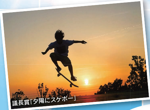
議長賞「夕陽にスケボー」