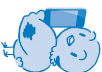
埼玉県議会公式アカウント「ボツガ」

○モバイル写真部門については、メールでの応募のみ受け付けます。CD、メモリーカードなどを送付いただいた場合は、すべて無効とさせていただきます。