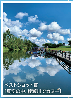
ベストショット賞「夏空の中、綾瀬川でカヌー」