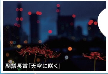
副議長賞「空に咲く」