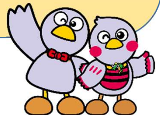
コバトン&さいたまっち