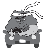
歩行者優先イメージキャラクター 「さいたまお父さん」