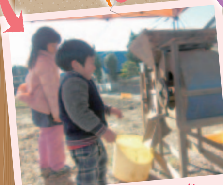
子育て 子供達が農作業に親しむ、大豆の脱穀体験。