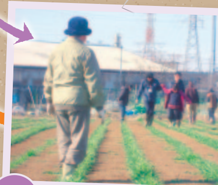
農福連携 農作業を通じて、障害者の自立を応援。