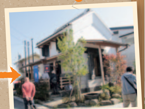
まちづくり 伝統ある蔵をカフェに再生し、地域の交流スペースに。