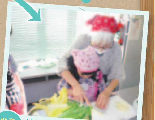
地産地消 地域の食材を使った料理教室で、地域の魅力を広める。