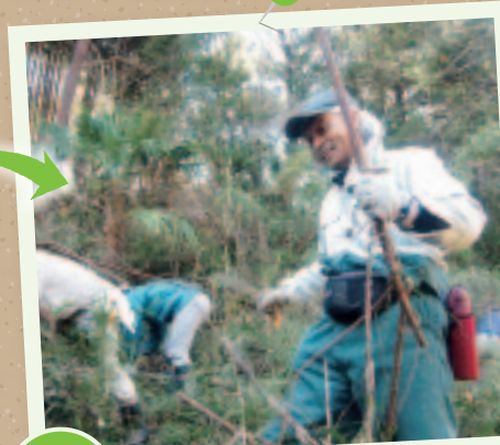
環境保全 藪草刈りで、貴重な森林を守る。