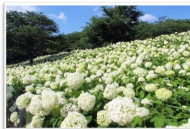
幸手市のアジサイ